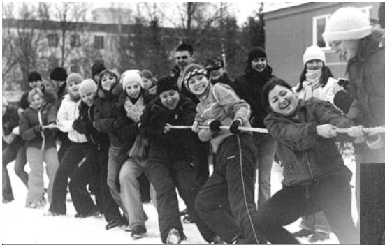
С такими девчатами не страшно и разведку...

И вот настал этот день. Толпа студентов стоит у входа в институт на морозе, с вещами, а их не пускают в ав-