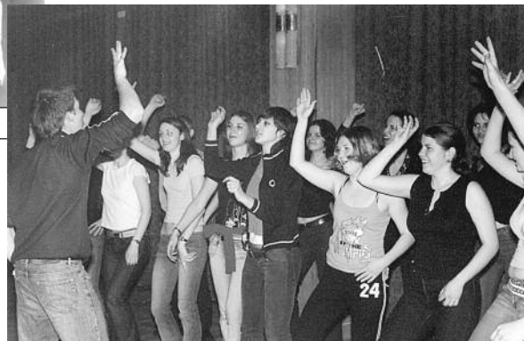
Танцевальный марафон: никто не хочет отставать.

Да, да. Именно в воде. Но не подумайте, что нас загнали в прорубь в замерзшей реке и заставили плавать. Нет. Все