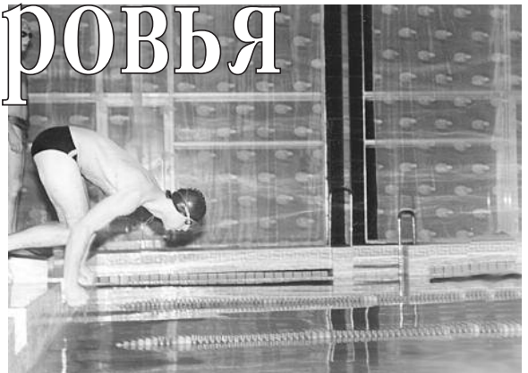
В бассейне д/о "Березки" парни показали себя во всей красе

было очень даже солидно! В доме отдыха оказался бассейн, кстати, далеко не маленький, и из каждой команды выбрали по 10 человек, которые должны были плавать на время разными стилями. Ну и без эстафет конечно же не обошлось! Все ребята так выкладывались, как будто они участвовали в соревнованиях мирового значения, особенно было интересно наблюдать за де-