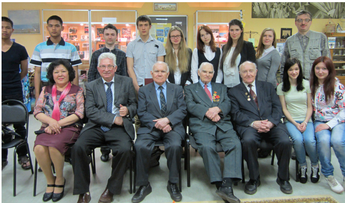
Общественный Совет Музея истории РХТУ с Советом ветеранов накануне Праздника Победы 6 мая 1913 г.