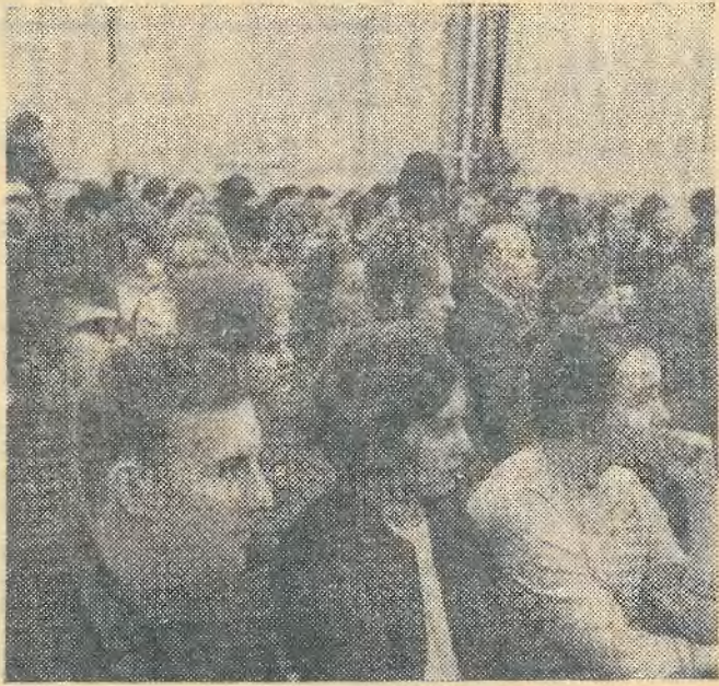
Студенты седьмого комсомольского факультета