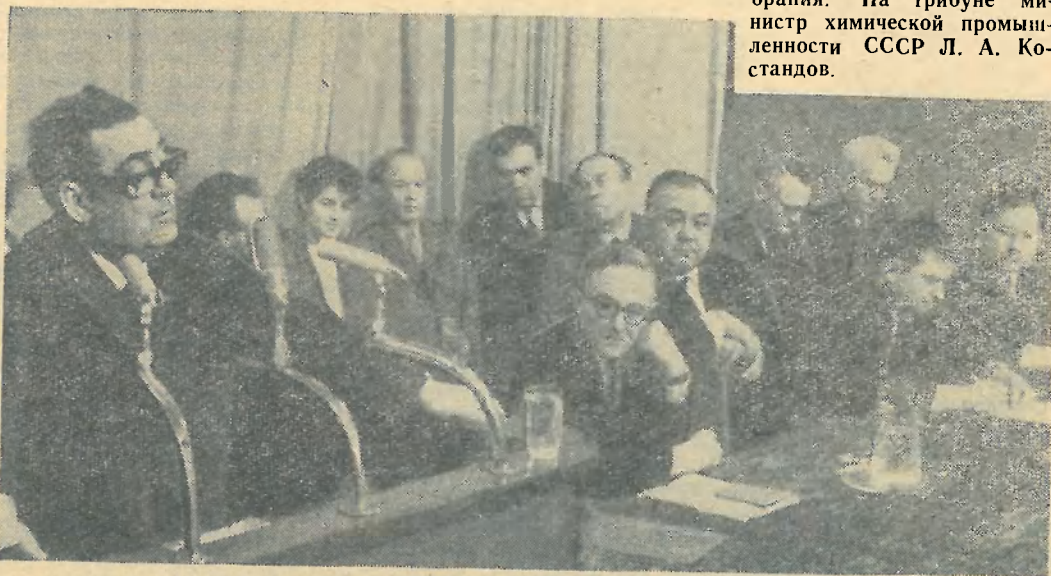
Президиум партийного собрания. На трибуне министр химической промышленности СССР Л. А. Костандов.