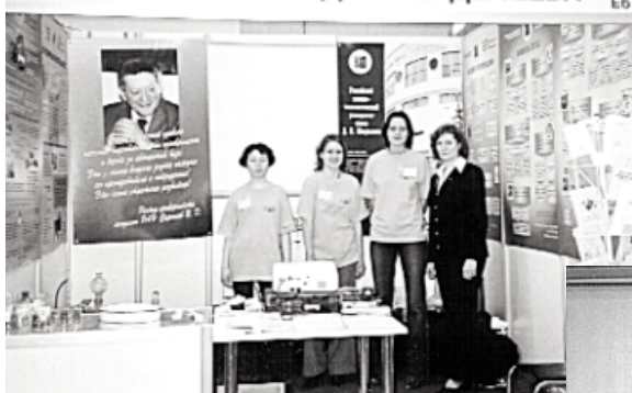
Стенд РХТУ на выставке "Образование и карьера"