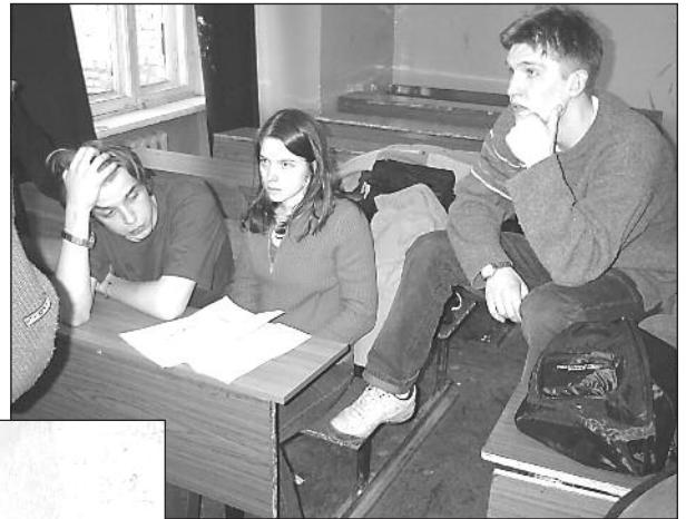
КВНщики за работой

Следующая проблема - встреча с редакторским составом, в нашем случае редакторами Московс-