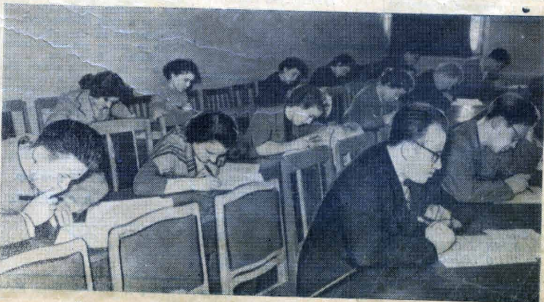
Письменная контрольная работа на I-ом курсе вечернего отделения.

Перевод с азербайджанского Ж. ПОЛЗИКОВОЙ.