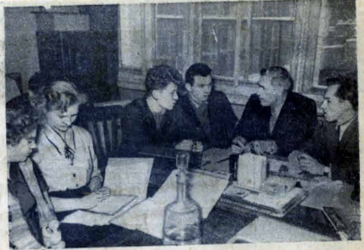
Члены профкома совместно с представителями спортклуба и кафедры физкультуры обсуждают план спортивно-оздоровительных мероприятий на зимние каникулы