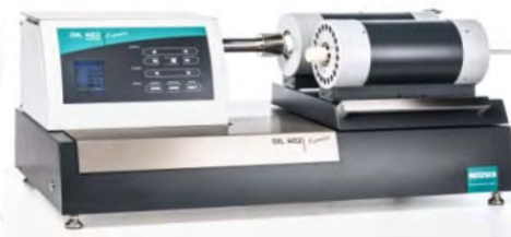
Дилатометр DIL 402 EXPEDIS Supreme