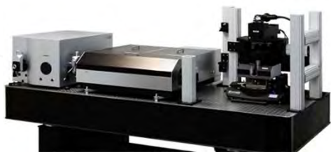
АСМ Раман, ФЛ