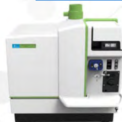
NexION 2000 ICP-MS