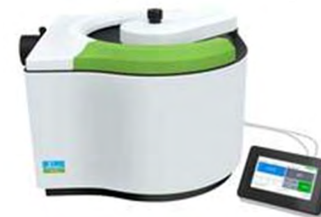
Система микроволнового разложения проб MPS-320