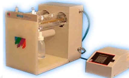
Система очистки кислот DuaPUR