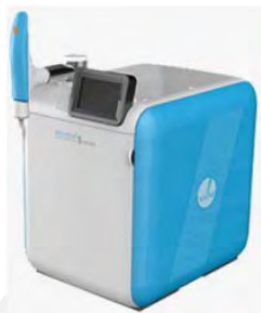
Система очистки воды Aquaruri 551