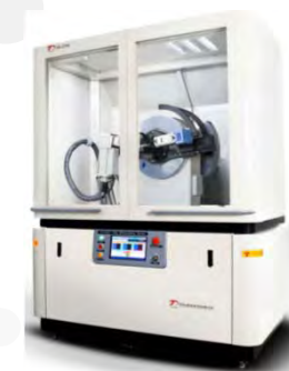
Рентгеновский дифрактометр TD-3700