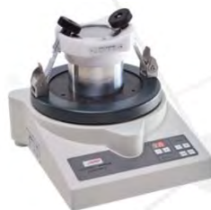
Вибромельница PULVERISETTE 0