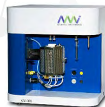
Анализатор удельной поверхности TOP 200