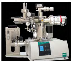
STA 449 F3 Jupiter